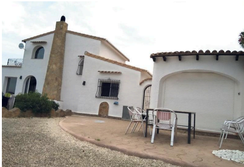
Het vakantiepark waar Charly T. over schreef zou zijn gegaan.

Wat ook standaard is bij de aanpak van Imamkhan: alle dossier-