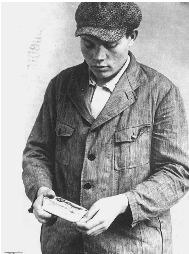
Archiefphoto uit 1933 van Marinus van der Lubbe.